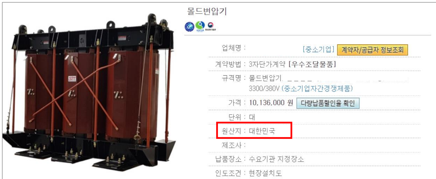
<나라장터 종합 쇼핑몰에서의 원산지표시>