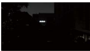
[ 일반 저조도 ]