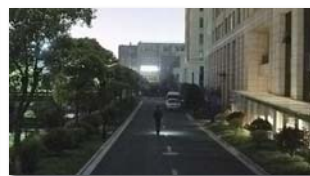
[ 초저조도 야간칼라 ]