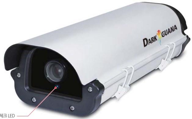
카메라 헬스 체크 LED