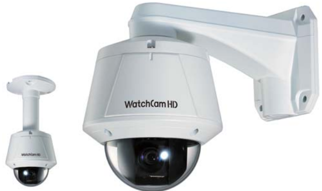
천장 부착형 타입