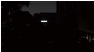
[ 일반 저조도 ]