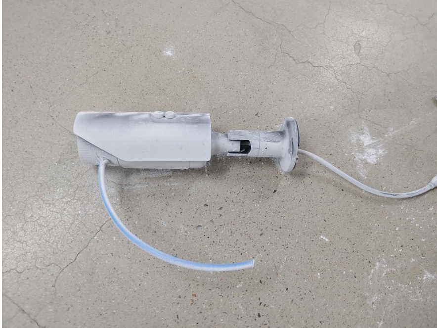
< 사진3. IP6X 시험 후 >