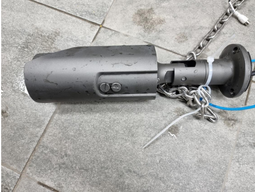
< 사진5. IPX7 시험 후 >