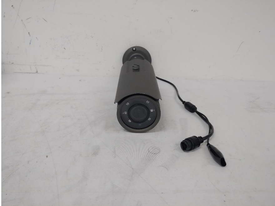
< 사진1. 정면 >