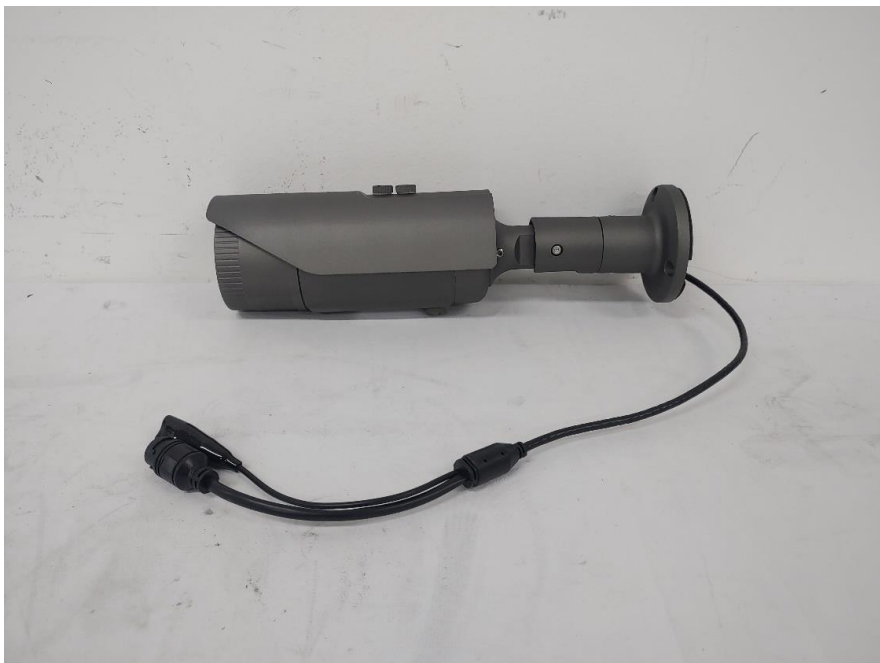
< 사진2. 측면 >

본 시험성적서의 진위확인은 DocuQR 홈페이지 및 애플리케이션 에서 가능합니다.