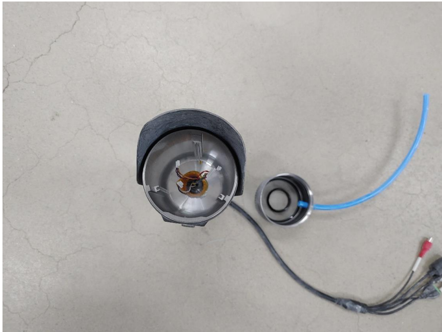
< 사진4. IP6X 시험 후 내부 >

본 시험성적서의 진위확인은 DocuQR 홈페이지 및 애플리케이션에서 가능합니다.