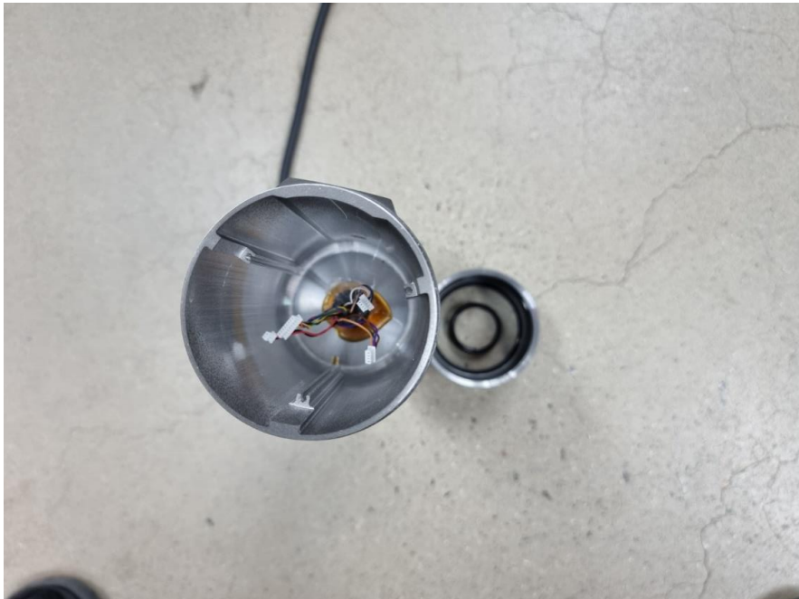
< 사진6. IPX7 시험 후 내부 >

본 시험성적서의 진위확인은 DocuQR 홈페이지 및 애플리케이션에서 가능합니다.