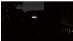
[ 일반 저조도 ]