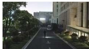
[ 초저조도 야간컬러 ]